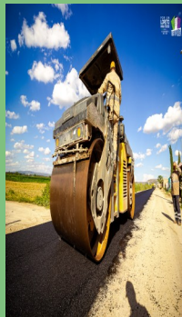
PAVIMENTACIÓN DEL TRAMO LORETO-GUADALUPE DE ATLAS, ASIENTOS