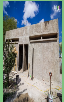
CONSTRUCCIÓN DE SANITARIOS EN LA CANCHA DE LA COLONIA SAN MANUEL