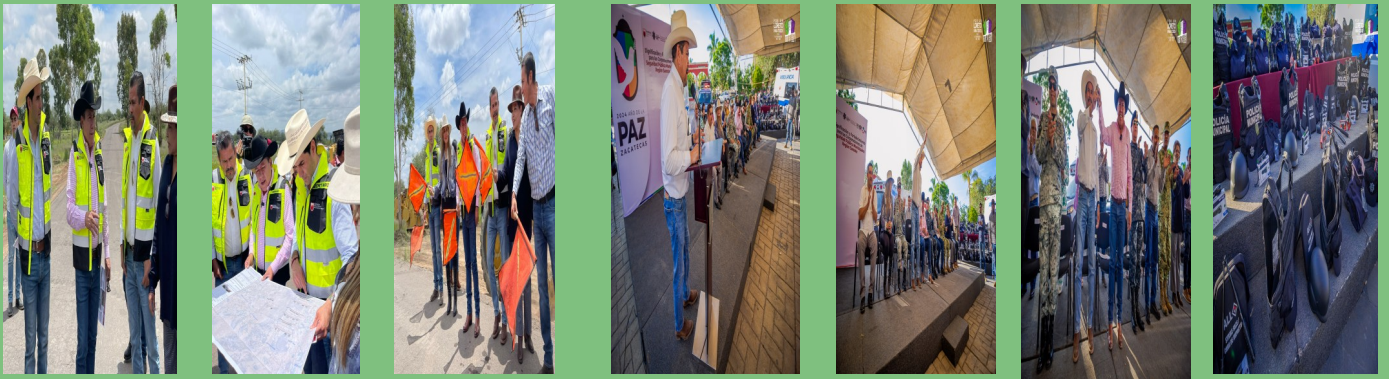
INICIO DE REHABILITACIÓN DE LA CARRETERA LUIS MOYA-LORETO