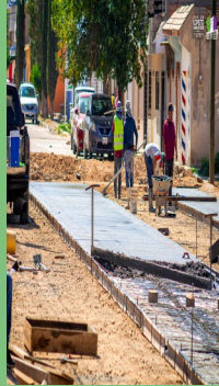
PAVIMENTACIÓN DE LA CALLE JUAN ALDAMA ENTRE JUAN MARTÍN COSS Y GALEANA