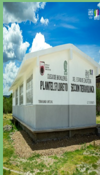
CONSTRUCCIÓN DE AULA EN EL PLANTEL 17 DEL COLEGIO DE BACHILLERES EN TIERRA BLANCA