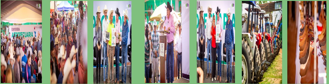
EXPOFERIA REGIONAL AGROPECUARIA