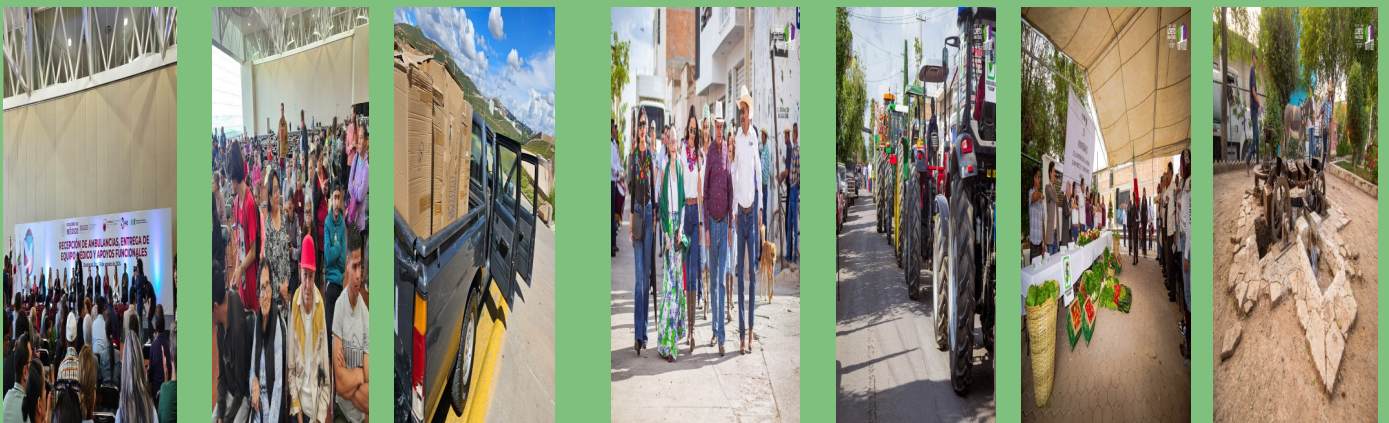
RECIBE DIF POR PARTE DE GOBIERNO DEL ESTADO APARATOS AUDITIVOS Y SILLAS DE RUEDAS