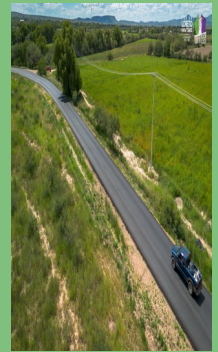
PAVIMENTACIÓN DEL TRAMO LA VENTA, LORETO—NORIAS DEL BORREGO, ASIENTOS