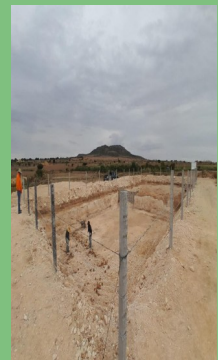
CONSTRUCCIÓN DE LAGUNA DE OXIDACIÓN EN EL HINOJO